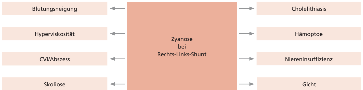
Abb. 2: Zentrale Zyanose - eine Multisystemerkrankung

sive proximale intraluminale Thromben charakteristische CT-Befunde bei ES-Patienten. Sie sind bei idiopathischer PAH eher selten. Bei fehlender Datenlage zur oralen Antikoagulation bei ES tendieren immer mehr Zentren dazu, Patienten ohne Hämoptoe-Anamnese zu antikoagulieren. Hierfür sind speziell vorbereitete Quick-Röhren zur INR-Messung nötig, bei denen die Menge des beigefügten Antikoagulans dem erhöhten Hämatokrit entsprechend reduziert ist.