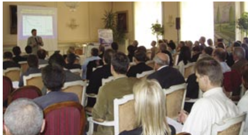
Am 2. Internationalen Kongress der SAPH diskutierte man über die neuen Behandlungsoptionen bei Pulmonaler Hypertonie. Viele Patienten werden jedoch noch immer viel zu spät diagnostiziert. Zusammenfassungen vom Kongress finden Sie auf Seite 3 und unter www.saph.ch .

leicht wird die Aufmerksamkeit auf die falsche Spur einer „rein psychischen Problematik“ gelenkt. Bereits ein einfacher