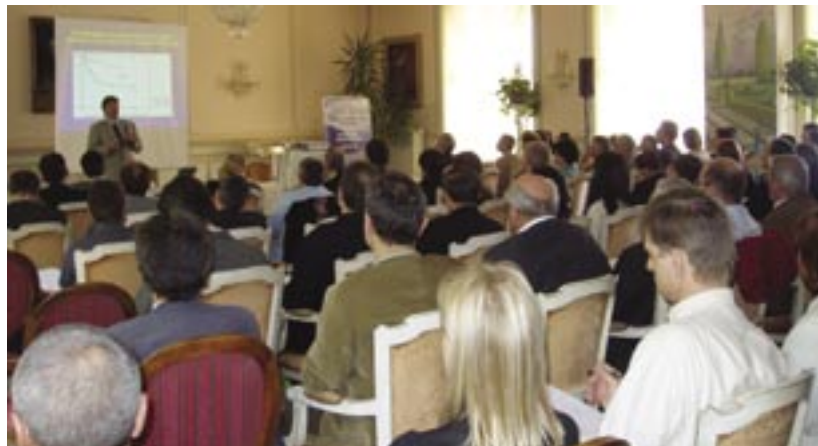
Am 2. Internationalen Kongress der SAPH diskutierte man über die neuen Behandlungsoptionen bei Pulmonaler Hypertonie. Viele Patienten werden jedoch noch immer viel zu spät diagnostiziert. Zusammenfassungen vom Kongress finden Sie auf Seite 3 und unter www.saph.ch .

leicht wird die Aufmerksamkeit auf die falsche Spur einer „rein psychischen Problematik“ gelenkt. Bereits ein einfacher